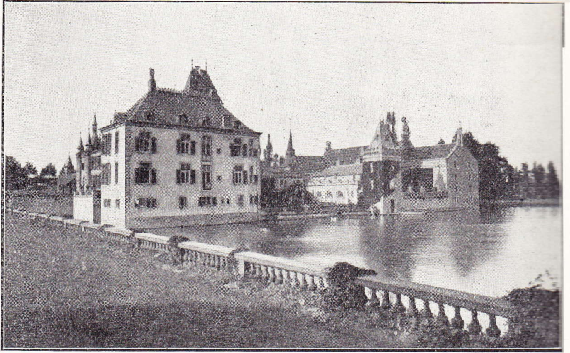
Clavier. — Le château d'Ochain

souveraineté. — La seigneurie de Vervoz appartient d'abord à l'abbaye de Stavelot (IX e s.). On ignore à partir de quelle époque Vervoz eut des seigneurs laïques particuliers. A la révolution française la seigneurie appartenait au baron de Tornaco. — La sei-